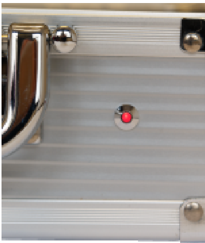
Fotografia 3 – Aceso

O período de carga é indicado nesse led com uma piscada modulada a uma frequência sempre mais veloz mais e mais que a maleta se aproxima ao 100% de carga.