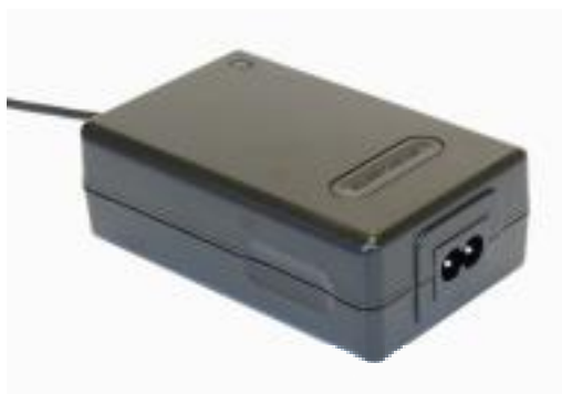
Fotografia 8 – Transformador

Transformador universal O transformador é um acessório indispensavel para o uso da maleta: permite de carregar o mesmo e pode ser usado em todos os paises do mundo graças a tecnologia switching.