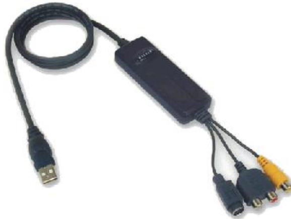
Fotografia 10 – Adaptatore Video a USB opcional.

Essa opção permite ao utente de conectar Portable TrueScan diretamente a um PC de mesa ou portátil, através a porta USB. Esse adaptador é fornecido completo de cabos e programas necessários para a captura dos filmes e video em formato MPEG e formato fotografia tipo JPG. Isso permite ao utente de creare uma propria livreria pessoal de riferimento com as imagens ou filmes registrados durante os analises de documentos ou papel de valores, e de editar ou imprimir as imagens capturadas. Todas as explicações da instalação, e os programas para o funcionamento dessa opção são contidas no correspondente manual de uso. Convidamos a ler as instruções e em caso de dificuldade pessa ao nosso suporte técnico.