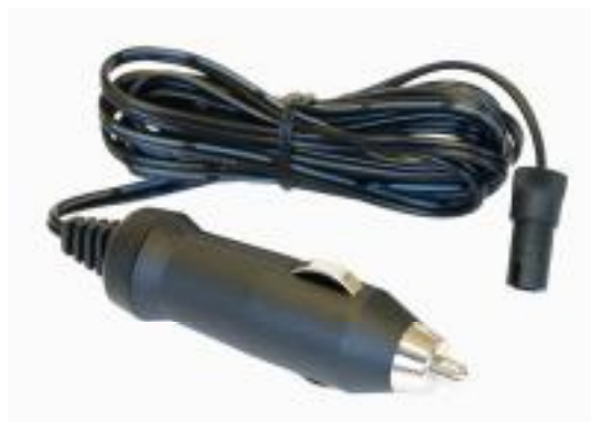
Fotografia 9 – Conexão para acendedor de cigarros

Conexão para o acendedor de cigarros O conector do acendedor de cigarros é particularmente util para a policia ou a quem viaja muito, porque permite de carregar e utilizar o Portable Truescan no carro.