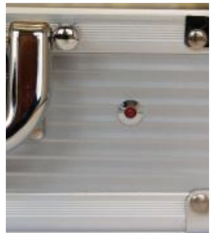
Fotografia 5 - Desligado