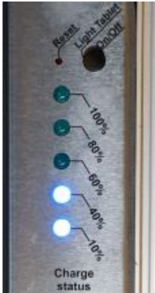
Fotografia 6 – Maleta acesa Carregada 40%

Os led azuis tem uma duplice função: indicar o estado de carga e sinalizar o estado de ignição da maleta.