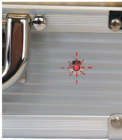
Fotografia 4 – Piscando