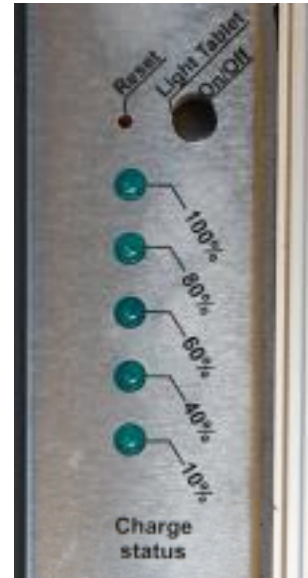
Fotografia 7 – Maleta apagada